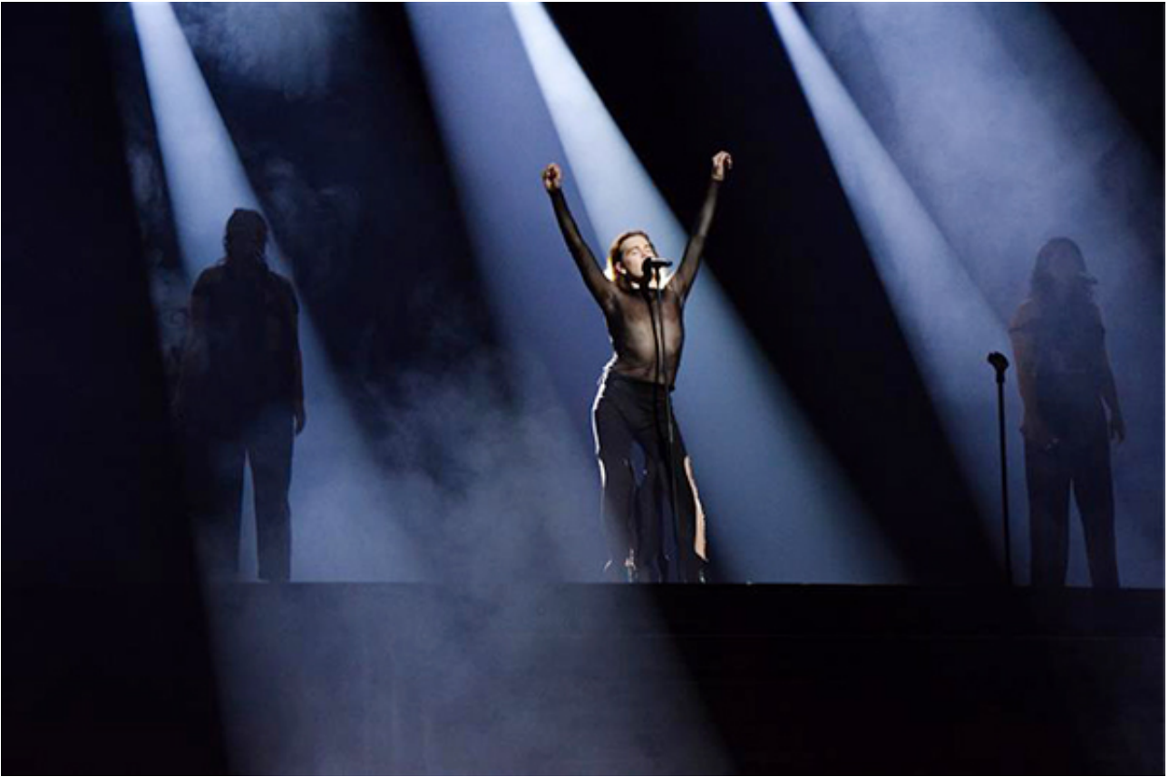
Metteson optrådte på konserten for frivillige i kulturlivet.